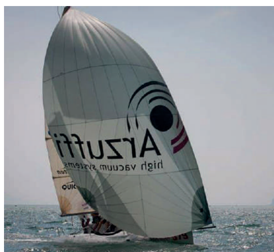
Campionato Europeo Melges 24 Riva del Garda. 4-10 Agosto..

Nella prossima stagione sarà garantito l'impegno e la partecipazione al Campionato del Mondo Melges24 che si svolgerà a Cagliari ed il campionato ORC European Sportboat che si terrà a Portorose, nella quale i nostri atleti regateranno da detentori del titolo.