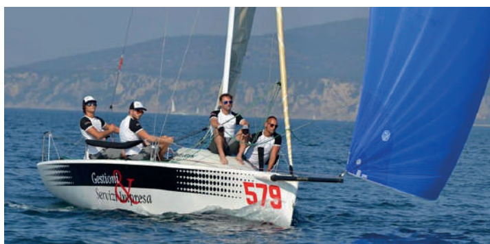
2° Tappa Melges 24 European Sailing Series, due ottimi 7 posti durante le regate. 27/29 Aprile..